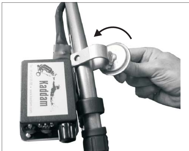
1. Introducir la brida inferior del portaparaguas encajándolo en el hueco que queda entre el final de la caja eléctrica y el conector del cable.