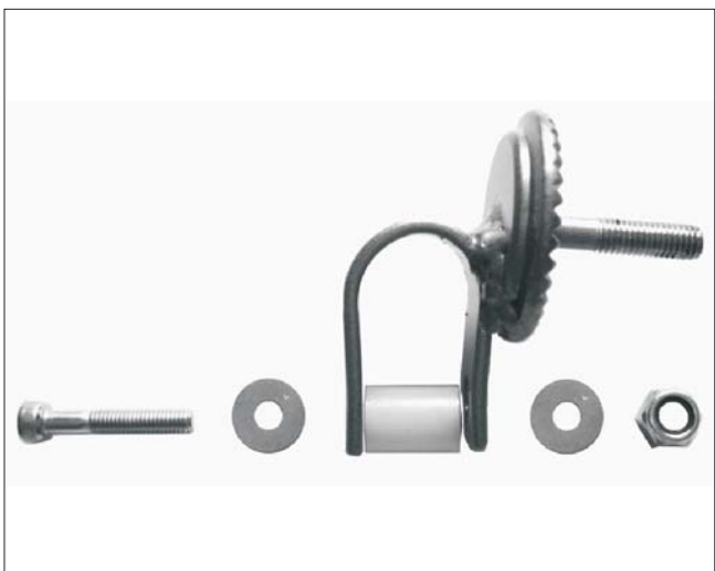
3. Detalle de colocación de arandelas y casquillo.