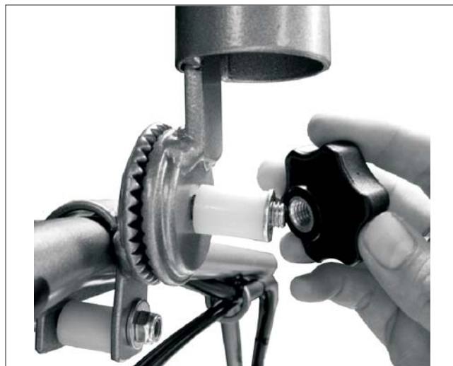
6. Finalmente, encajar el soporte superior del portasombrillas y roscar el pomo hexagonal.