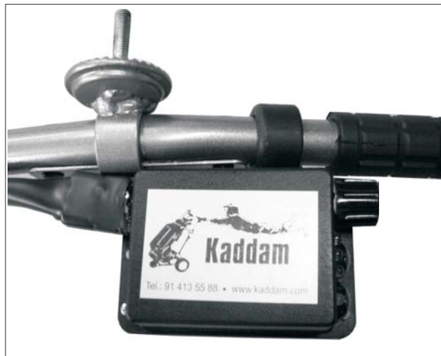
2. Posición correcta de la brida inferior.