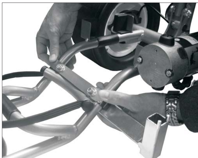
3. Insertar los tornillos, la pletina y las tuercas.