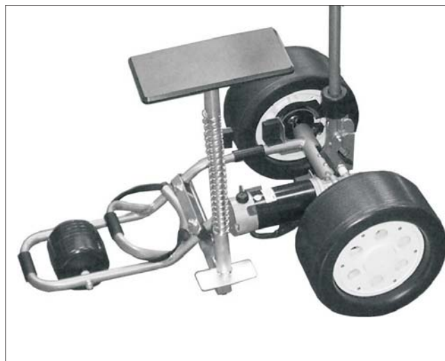
6. Colocación final del asiento.