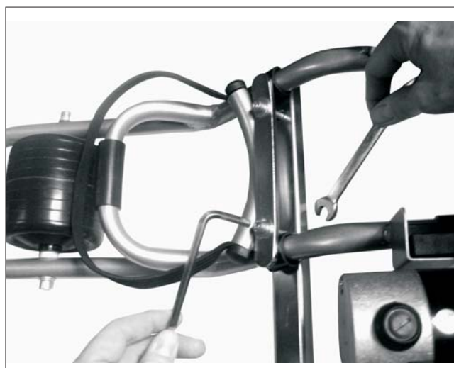
4. Apretar con llave allen y llave fija.