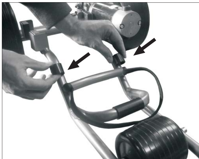
1. Introducir los dos protectores de plástico negro.